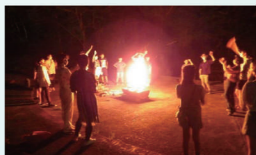
郡上フォレストパーク373にてキャンプファイヤー