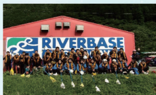
郡上の長良川におけるラフティング体験