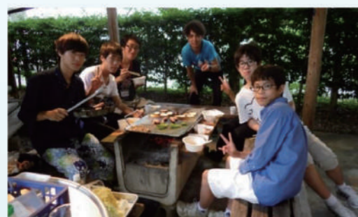
夕食のバーベキュー中の中・高校生