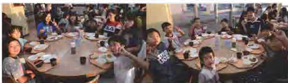
夕食はバイキング方式で各班に美味しく食べました