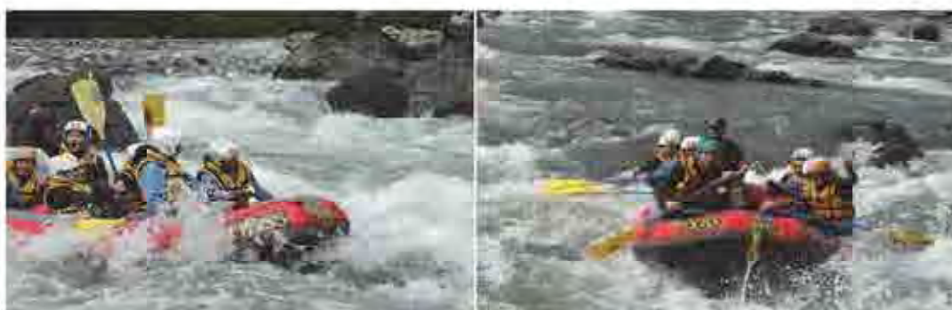
郡上の長良川におけるラフティング体験