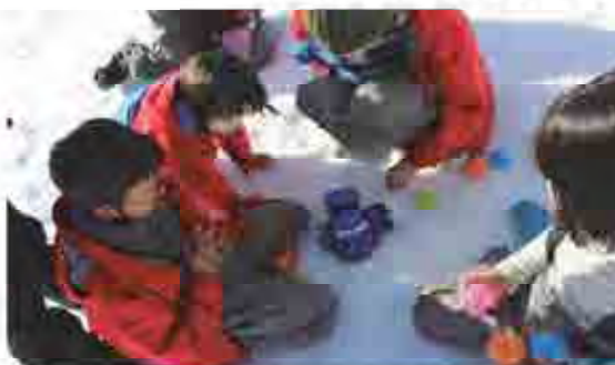
宝探しを終わっての成果物を数える