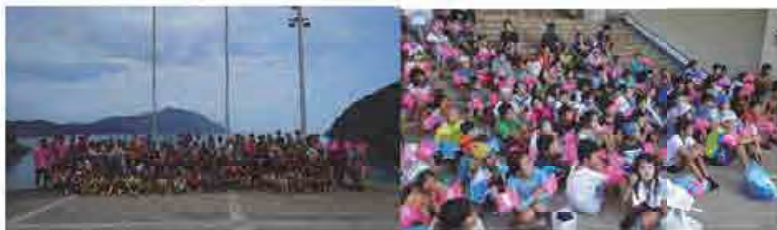
朝のつどい後若狭湾をバックに全員写真