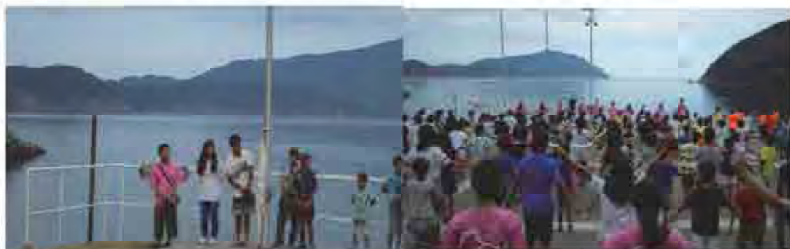
第2日目の朝のつどいにて旅揚げとラジオ体操