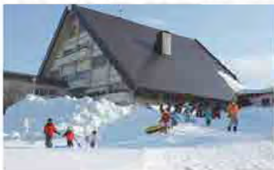
乗鞍交流の家からソリすべりの場所まで移動