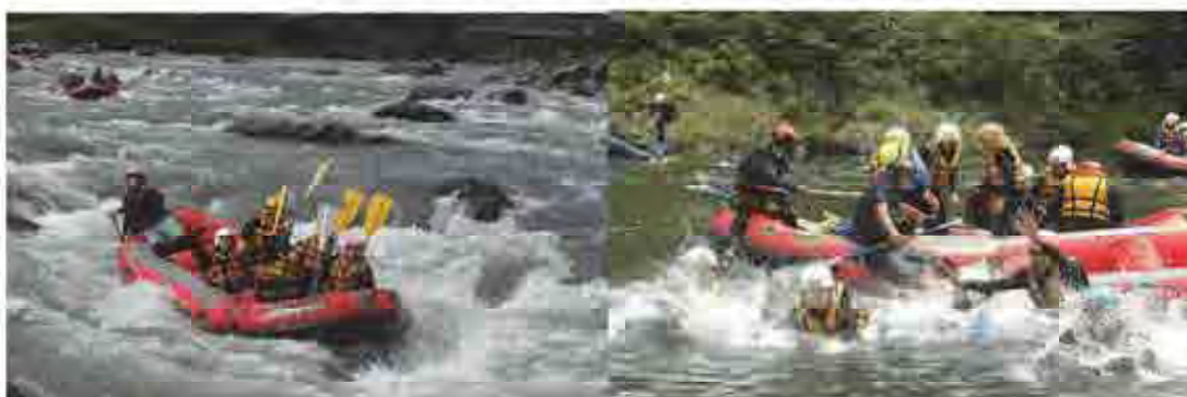
郡上の長良川におけるラフティング体験