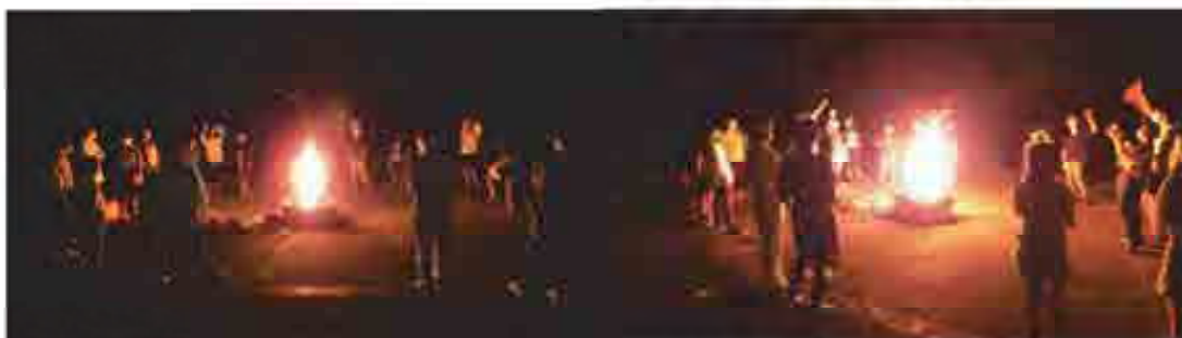
郡上フォレストパーク373におけるキャンプファイヤー