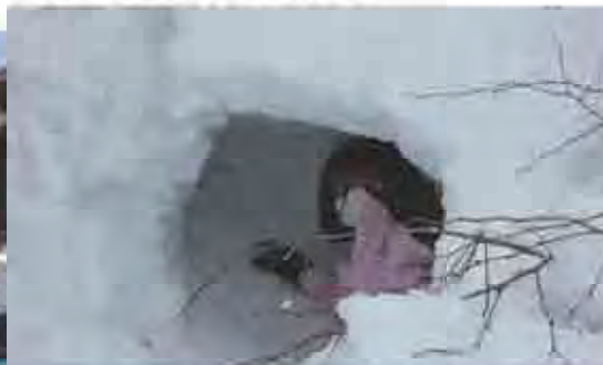
かまくら作りを頑張る子どもたち