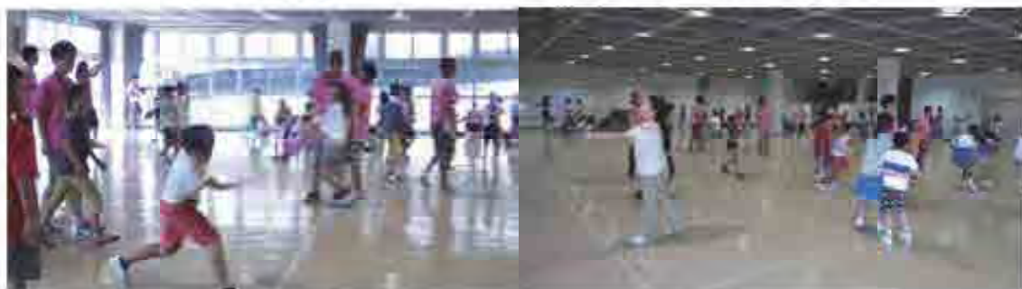
第1日目の午後からブレイルームでドッチビーの班別対抗