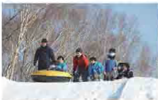
雪山の頂上から順番にソリすべりをして楽しんでいる子どもたち