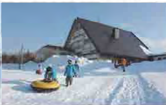
ソリを滑らしてソリが出来る場所まで移動中