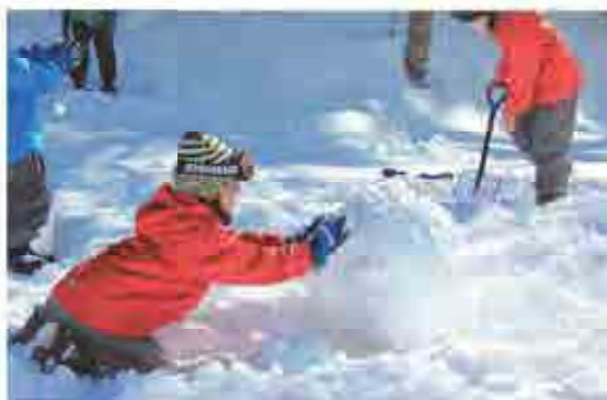
前日から雪が降りソリすべりの横で雪だるまつくりを楽しむ