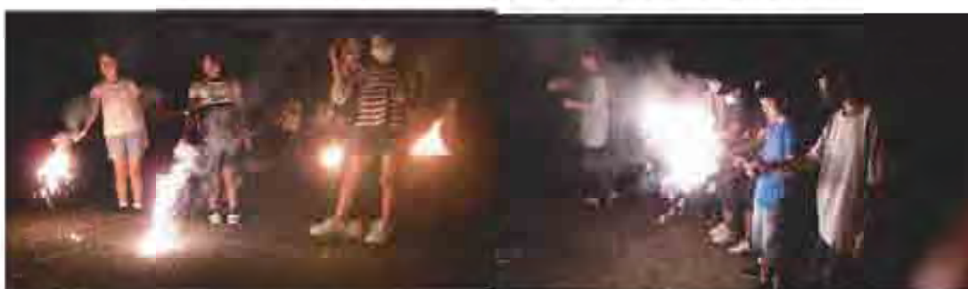
郡上フォレストパーク373における花火体験