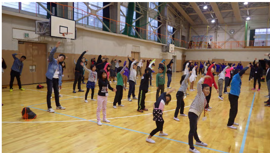
朝のつどいにて参加団体全員にてラジオ体操