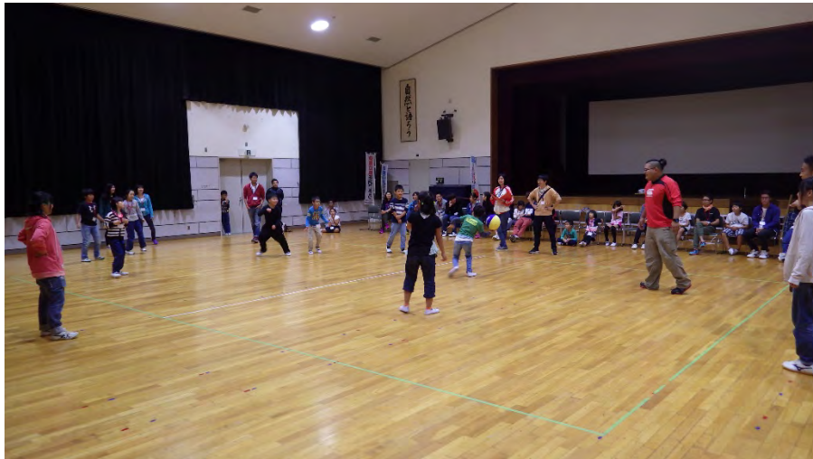
班対抗のドッチボール大会