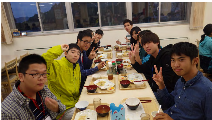
おいしい夕食中の高校生グループのメンバー