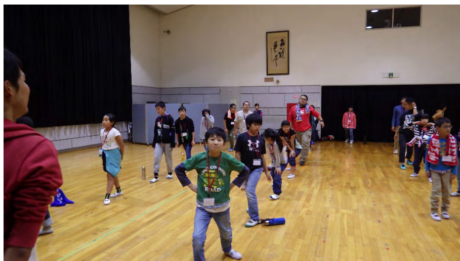
昼食後荷物を部屋に入れて講堂にてレクリエーション前の準備運動