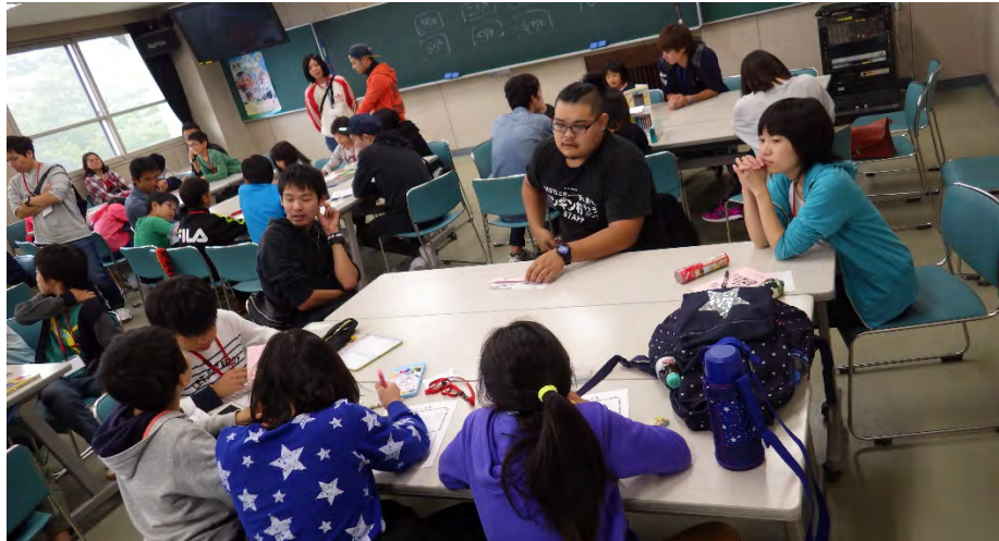
2泊3日に登山キャンプの絵日記の作成中の子どもたち