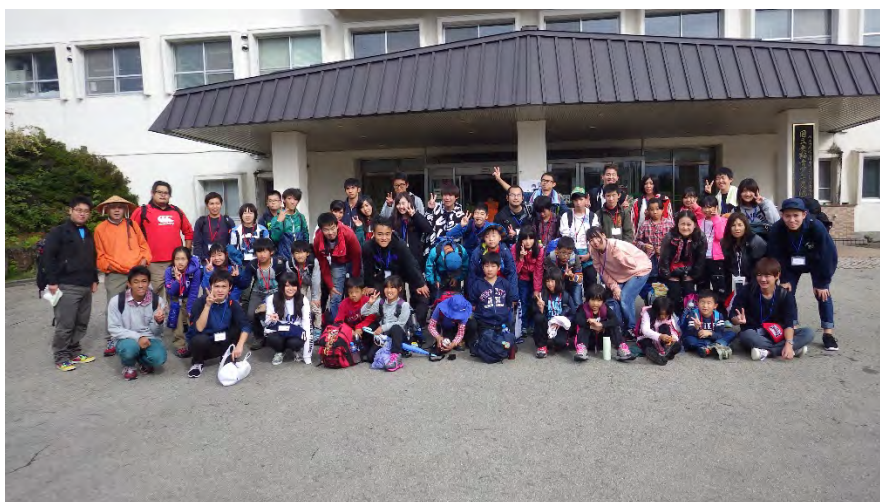
台風接近のため乗鞍登山を中止して上高地に出発前の玄関で

到着時から台風の影響で雨のため体育館で昼食、開所式を行う。午後からは講堂でドッチボール、2日目も台風接近のため乗鞍登山を中止して上高地に変更して出発。途中から天候が良くなりつつあったので乗鞍登山に変更。曇平までいき途中まで登山をしましたが、天候が心配のため引き返す。夜は外が雨のため講堂でキャンドルファイヤーを行う。3日目の最終日はクラフト体験と絵日記を作成。2日間雨のため外での活動ができなかったですが、青年の家の中で全員で楽しむことができました。帰りは高山でお土産を買って全員無事に名古屋へ帰ってきました。