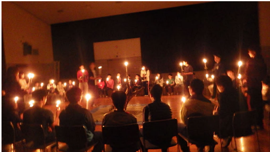
雨天のために講堂にてキャンドルサービスに変更