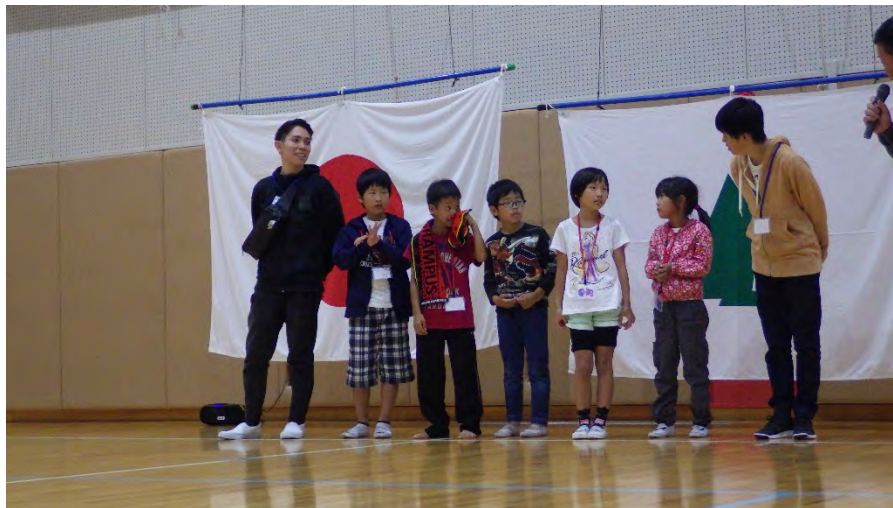
夕べのつどいにて旗係で5名が代表で参加後自己紹介中