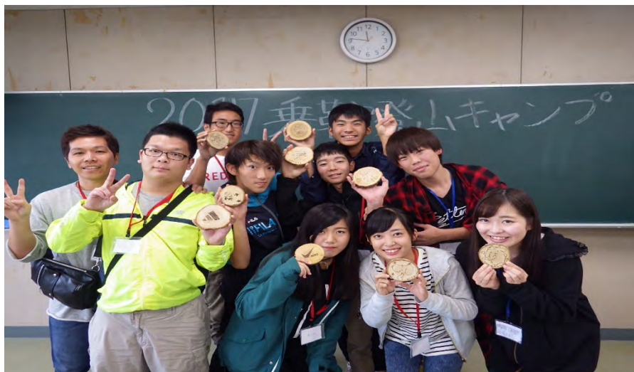
高校生グループによる出来上がったコースターを全員の前で披露