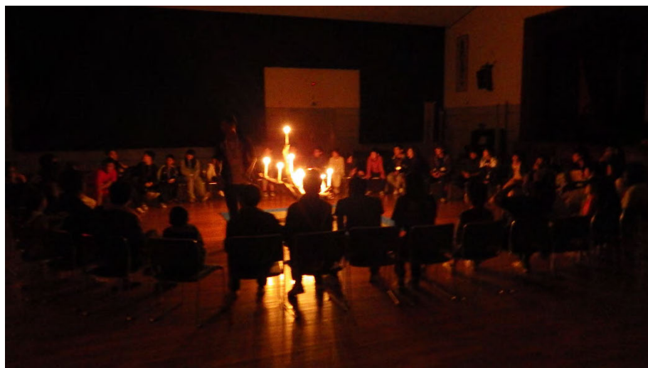
全員での歌やゲームで盛り上がりました